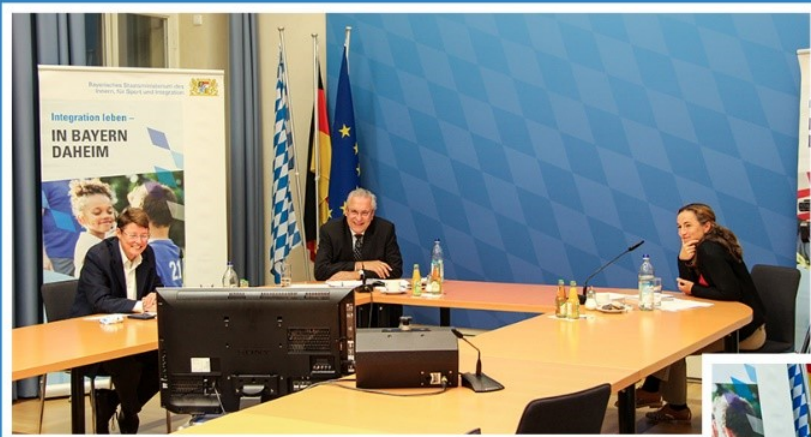
Digitaler Austausch von Integrationsminister Joachim Herrmann mit bayerischen Asylhelfern

„Rückblick und Ausblick – Entwicklung des Ehrenamts im Bereich Asyl und Integration“ war das Thema beim ersten „Dialog digital“ am 3. November 2020, zu dem Staatsminister Joachim Herrmann die Asylhelferkreise eingeladen hatte. „Der Austausch mit den Ehrenamtlichen ist mir sehr wichtig! Ohne sie hätten wir weder das Ankunftsgeschehen in den Jahren 2015 und 2016 bewältigen können, noch wäre die Integration der Flüchtlinge so gut gelungen“, sagte der Minister anerkennend. Dialog und gegenseitige Wertschätzung auch bei inhaltlichen Differenzen seien die stärksten Gegenmittel gegen Rassismus und Intoleranz. „Auch wenn noch viel zu tun ist, können wir stolz auf das Geleistete sein. Was die Ehrenamtlichen auf die Beine gestellt haben, war und ist eine Meisterleistung bürgerschaftlichen Engagements“, betonte Herrmann einleitend. Mehr als 130 engagierte Bürgerinnen und Bürger waren der Einladung Herrmanns zum Austausch im neuen Format gefolgt.